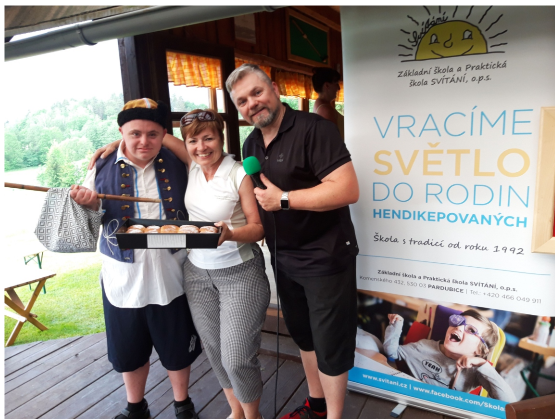
Domácí české buchty od Českého Honzy byly tečkou za jubilejním 20. ročníkem benefičního golfového turnaje Svítání Cup.

Generální partnerem akce byla Správa a údržba silnic Pardubického kraje. Mezi významné podporovatele patří rovněž firmy Top centrum, Alupa, Jednota, Agrostav, Dopravní značení Pardubice či Ekofarma Rohoznice. Akce se uskutečnila pod záštitou místopředsedkyně Senátu Parlamentu České republiky a ředitelky školy Svítání Miluše Horské a vícehejtmana Pardubického kraje Romana Línk.